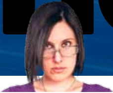
Riječ urednika Ana Nives Radović